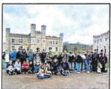
Die Englandfahrer vor Leeds Castle in Kent

30 Schülerinnen und Schüler der 9. und 10. Klassen der Heisenberg-Gymnasien Ettlingen und Karlsruhe machten sich vom 25.2. bis 1.3.2024 mit Herrn Zimmermann, Herrn Cooper und Frau Brucker auf